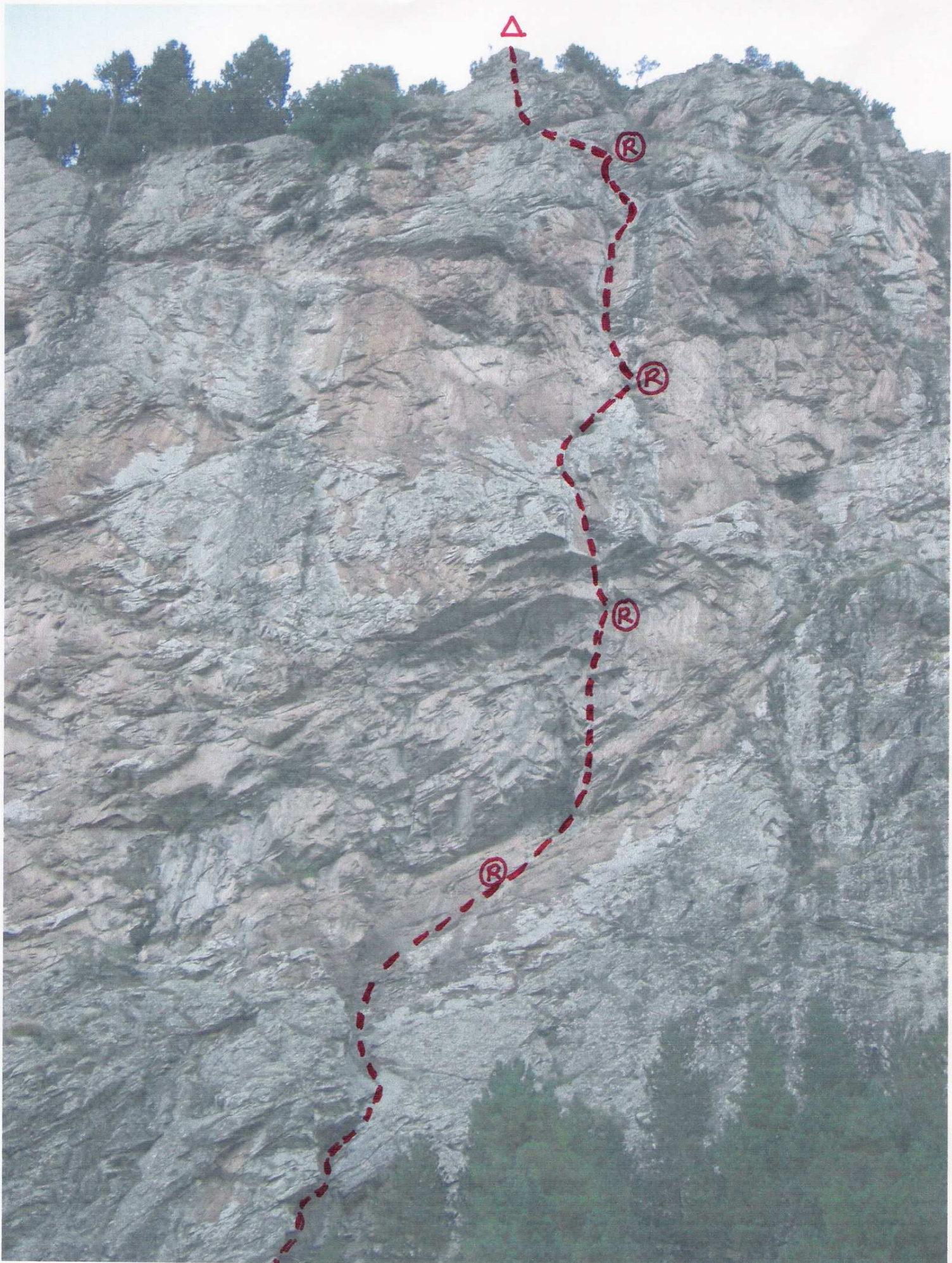
" PÀNIC SOBSTAT "